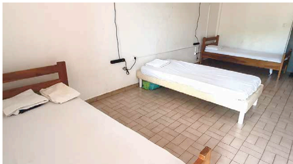
Le Manteau de Saint-Martin / Alefpa accueille dans son centre d'hébergement d'urgence des hommes sans domicile.

Mais le saisonnier a toujours aimé la fête,